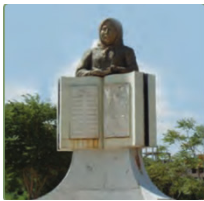
تلك الشاعرة بروين