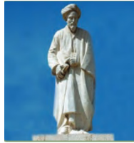
ذلك الشاعر سعدي