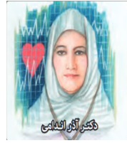
هذه الطبيبة ناجحة