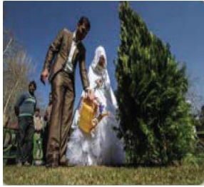
الصورة ٣: نموذج من العملية السردية العابرة

(مركز البحث والتخطيط التعليمي (١)، ١٤٠٢: ٨٩)