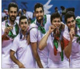
الصورة ٩: نموذج من الشخصية الجماعية

(مركز البحث و التخطيط التعليمي (١)، ١٤٠٢: ٩)