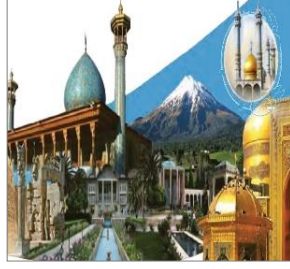
الصورة ٤: نموذج من العملية المفاهيمية التصنيفية

(مركز البحث و التخطيط التعليمي (١)، ١٤٠٢: ٨٢)