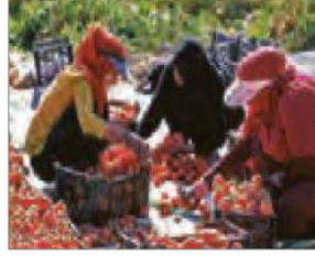
الصورة ٧: نموذج من الشخصية الجماعية

(مركز البحث و التخطيط التعليمي (١)، ١٤٠٢: ٩)