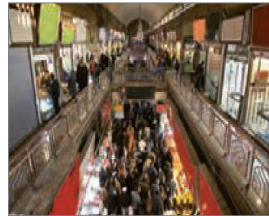
الصورة ١٤: نموذج من البيئة الأصلية للمجتمع

(مركز البحث والتخطيط التعليمي (٣)، ١٤٠٢: ١٣)