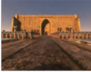
الصورة ١٨: نموذج من البيئة الإقليمية غير الأصلية (مركز البحث و التخطيط التعليمي (٣)، ١٤٠٢: ٣١)