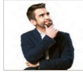
الصورة ٨: نموذج من الصورة الفردية

(مركز البحث و التخطيط التعليمي (٣)، ١٤٠٢: ٢٦)