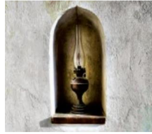
الصورة ٥: نموذج من العملية المفاهيمية الرمزية الصورة

(مركز البحث و التخطيط التعليمي (٣)، ١٤٠٢: ٥٥)