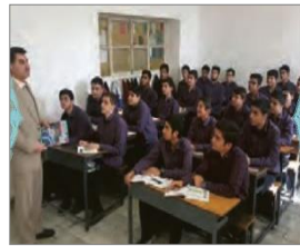
الصورة ١٣: نموذج من البيئة الأصلية للمدرسة

(مركز البحث والتخطيط التعليمي (١)، ١٤٠٢: ٤٢)