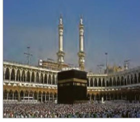
الصورة ١٦: نموذج من البيئة الإقليمية غير الأصلية (مركز البحث و التخطيط التعليمي (١)، ١٤٠٢: ٥٣)