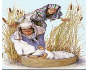
الصورة ١٠: نموذج من الشخصيات الكارتونية

(مركز البحث و التخطيط التعليمي (١)، ١٤٠٢: ٤٩)