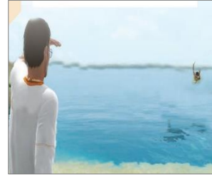
الصورة ١١: نموذج من الشخصيات الكارتونية

(مركز البحث و التخطيط التعليمي (٣)، ١٤٠٢: ٤٠)