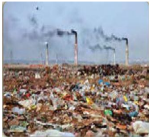
الصورة ٦: نموذج من العملية المفاهيمية

(مركز البحث و التخطيط التعليمي (١)، ١٤٠٢: ٨٢)