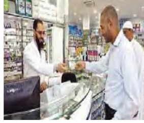
الصورة ١: نموذج من العملية السردية العابرة

(مركز البحث والتخطيط التعليمي (١)، ١٤٠٢: ٨٩)