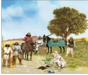
الصورة ١٢: نموذج من الشخصيات الكارتونية

(مركز البحث و التخطيط التعليمي (١)، ١٤٠٢: ٤٩)