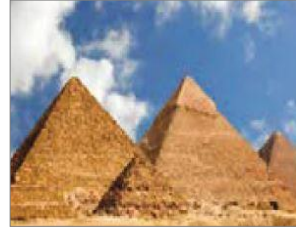
الصورة ١٧: نموذج من البيئة الإقليمية غير الأصلية (مركز البحث و التخطيط التعليمي (٢)، ١٤٠٢: ٥٦)

إنّ نوعاً آخر من البيئة المدروسة هو البيئة غير الأصلية، والتي تقسم إلى قسمين: البيئة الإقليمية والبيئة العالمية. قلما استخدمت الصور ذات البيئات غير الأصلية مقارنة بالبيئات الأصلية، ومن بينها، تم تصوير البيئات غير الأصلية من النوع الإقليمي فقط. على سبيل المثال، في الصورة ١٦ تم إظهار البيئة غير الأصلية لبيت الله الحرام (الكعبة) في مكة المكرمة. تصور الصورة ١٧ البيئة غير الأصلية للأهرامات الثلاثة في مصر، والصورة ١٨ تتعلق بالبيئة غير الأصلية في تيسفون الواقعة غرب بغداد في العراق. ولذلك تعتبر هذه الدول حسب موقعها بيئة غير أصلية من النوع الإقليمي (القارة الآسيوية). لم تستخدم الصور غير الأصلية من النوع العالمي في أي صورة من صور كتب الصفوف الثلاث.