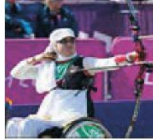
الصورة ٢: نموذج من العملية السردية غير العابرة

(مركز البحث والتخطيط التعليمي (٣)، ١٤٠٢: ٤١)